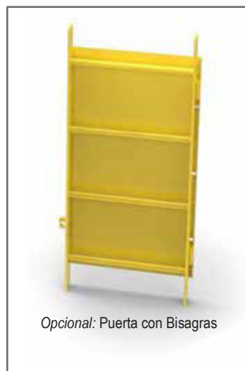
Opcional: Puerta con Bisagras