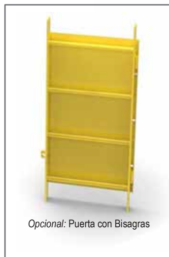
Opcional: Puerta con Bisagras

NOTA: Todos los requerimientos de la aplicación son diferentes dependiendo de las condiciones del sitio. Acudor ha proporcionado su Sistema de Escalera en piezas modulares para permitir un ajuste perfecto para todos los usos. Todos los componentes se venden por separado. Vea una lista de piezas y una referencia de ejemplo al reverso de esta página.